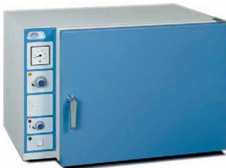
Modelo Conterm tipo Poupinel, códigos 2000200 y 2000201.