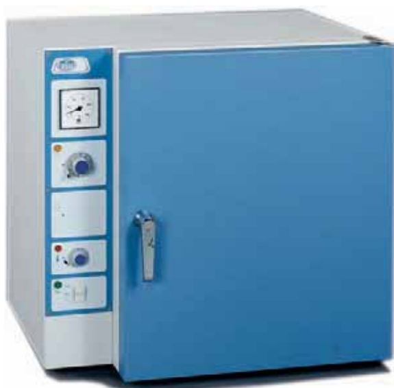
Modelos Conterm, códigos 2000208, 2000209 y 2000210.

CARACTERÍSTICAS, PANEL DE MANDOS, SEGURIDAD, NORMAS Y ACCESORIOS (ver págs. 180 y 181).